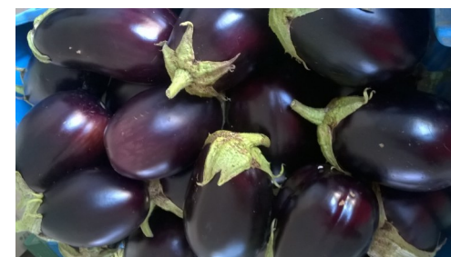
Melanzana Dalia (ovale)